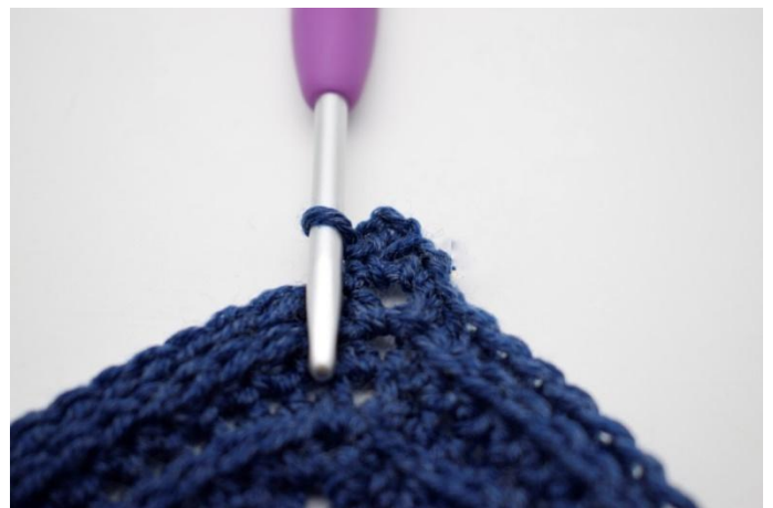
6. Haak 1 V in L-boog.