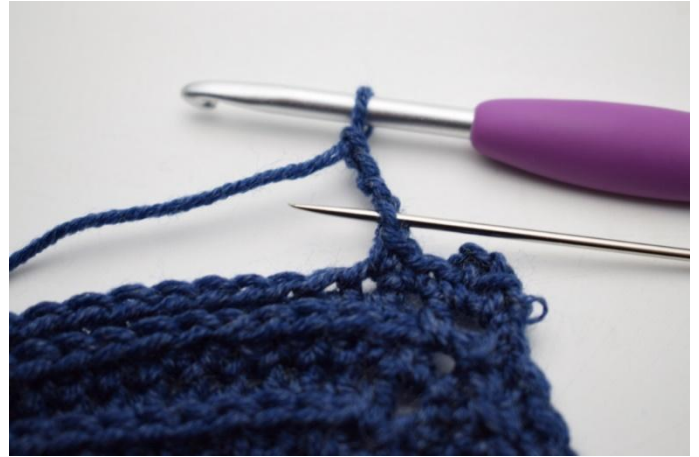
10. Haak 1 Hv in 1e L.