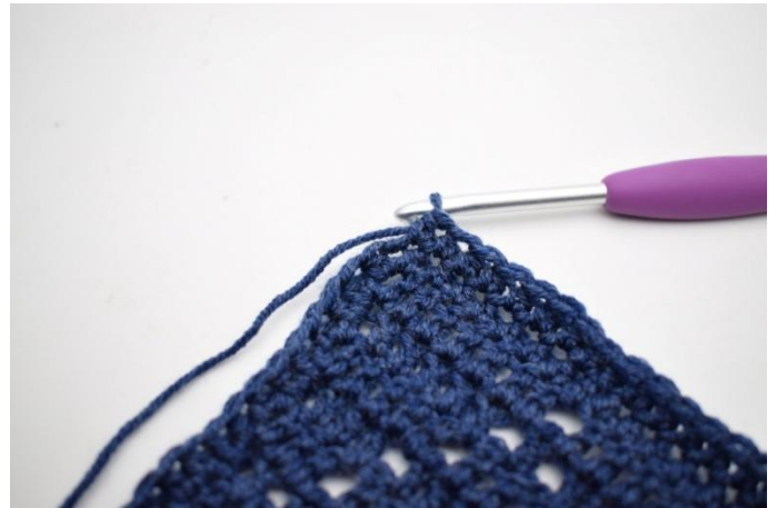
4. "Haak 1 Hstk in volgende 159 steken.