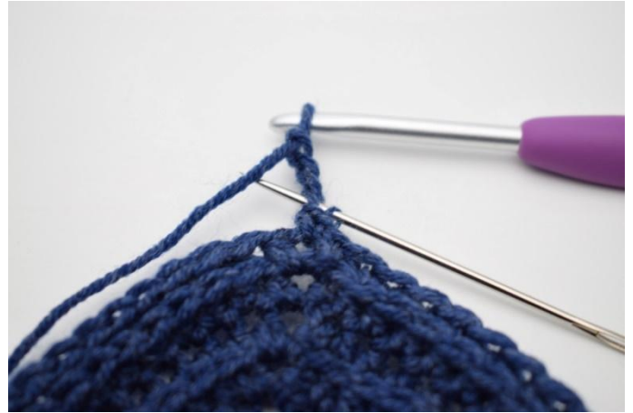
4. Haak 1 Hv in 1e L.