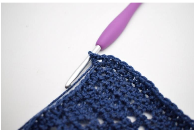
5. In L-boog van hoek 1 Hstk, 2 L en 1 Hstk".