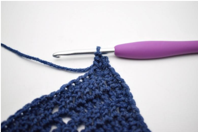
3. Haak 1 Hstk in L-boog.