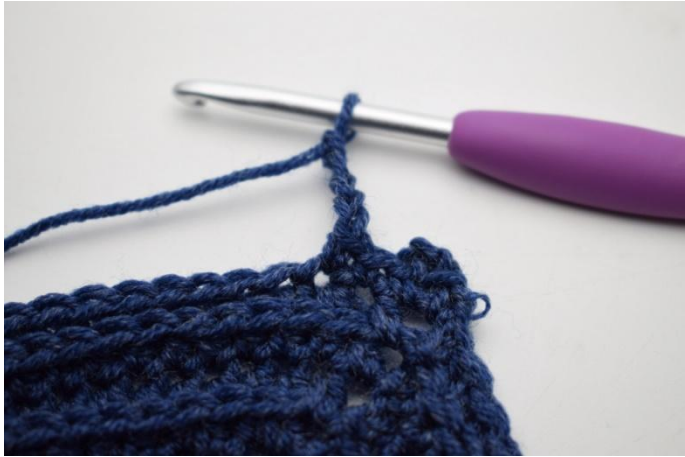
9. Haak 4 L.