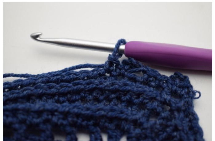
14. ”Haak 1 V in volgende steek.