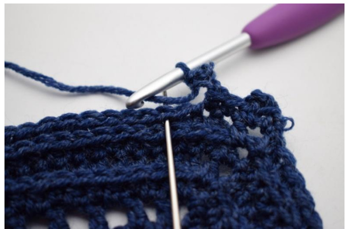
12. Sla 1 steek over en haak 1 V in volgende steek”.