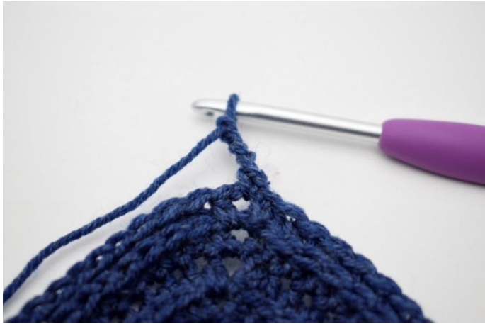
3. Haak 4 L.