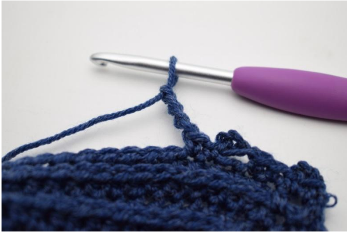
15. Haak 4 L.