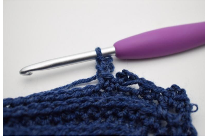
16. Haak 1 Hv in 1e L.