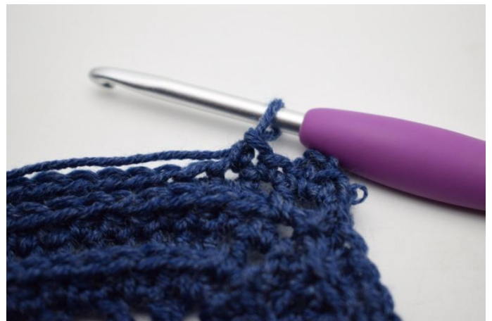
8. "Haak 1 V in volgende steek.