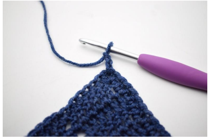
2. Haak 3 L.