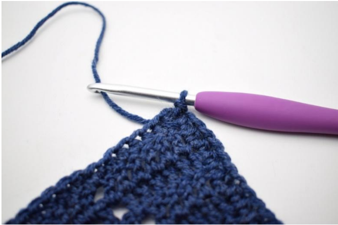
1. Haak 1 Hv om de L-boog.