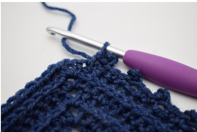
Herhaal “tot” in totaal 59x.