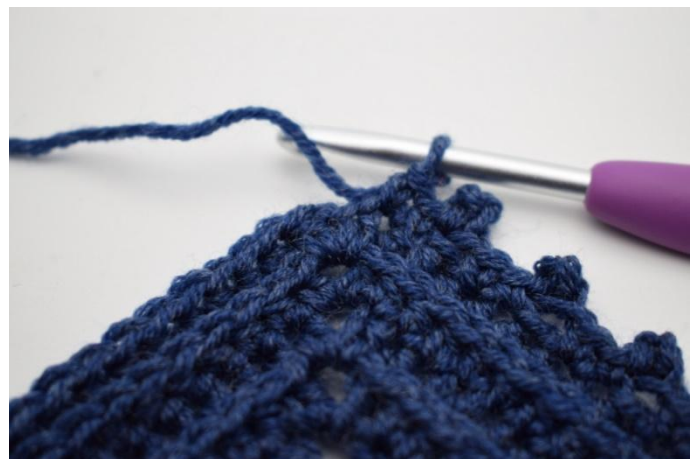
19. Haak 1 V in laatste steek.