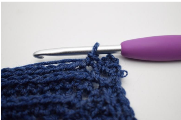
7. (Haak 1 V in eerste steek.