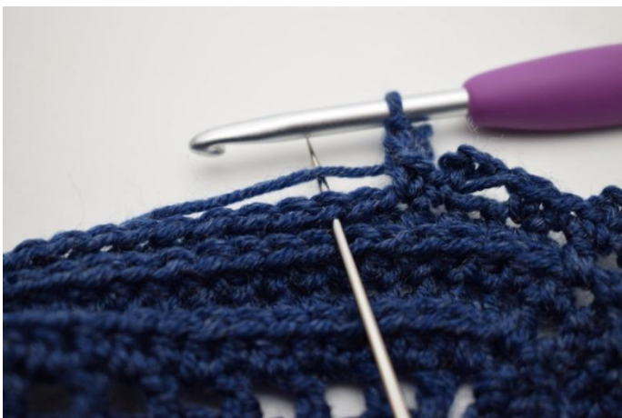
17. Sla 1 steek over en haak 1 V in volgende steek”.