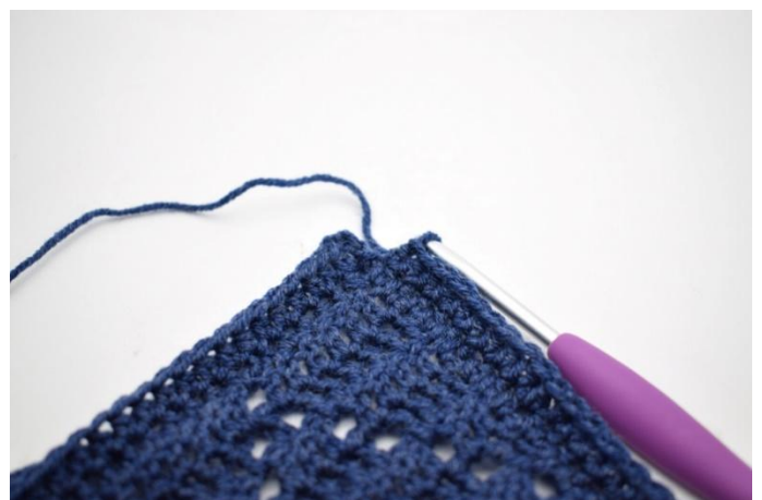
6. "Haak 1 Hstk in de volgende 159 steken. In L-boog van hoek 1 Hstk, 2 L en 1 Hstk". Herhaal "tot" in totaal 3x.